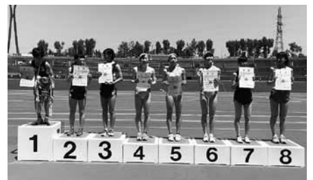
令和最初の県高校総体女子3000m、1位2位3位独占。

今年も、強化の暑い夏が始まります。これからも女子駅伝競走部への応援をよろしくお願いたします。