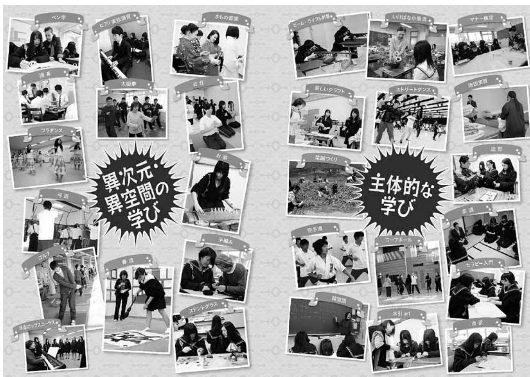
<受講風景（「遊学講座ガイドブック」より）↑>

遊学講座は、「遊学の精神の涵養」を建学の精神に掲げる本校独自の取り組みとして、今年で28年目を迎えます。“異次元・異空間の学び”、“主体的な学び”をキャッチフレーズに、年間24回の土曜日に実施されています。生徒は60余りの講座から、学年やコースに関係なく好きな講座を選択します。講座は、資格取得、受験対策、スポーツ・芸術、趣味・教養など様々です。講師は本校教員だけでなく、校外からも一流の先生方をお招きしています。また、学びの場を広く校外にも求め、金城大学、老人ホーム、ゴルフガーデン、クッキングスクールなどに加え、3年前から“街なかキャンパス”と称して北國新聞会館、香林坊ラモダスタジオ、北国会館香林坊プラザでも講座を開設しています。毎年選ぶ講座を変えて幅を広げるもよし、3年間同じ講座を選んで腕を上げるもよし、生徒達は自分の個性やニーズに合わせ、主体的な姿勢で受講することが求められます。保護者や卒業生が特性を生かして教壇に立たれることもありますので、今後も魅力ある講座を増やし、この特色をさらに発展させたいと考えています。