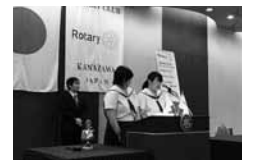
ロータリークラブ例会