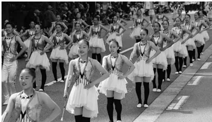
百万石パレード「行進演技写真」