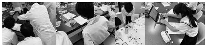
2019年度 春の実験・実習セミナーに参加したときの様子【金沢工業大学にて】

現在、1年生の部員が4名で活動しています。理科部では、個人個人の目的や興味に応じて、主体的に取り組めるようアドバイス等を交えながら、活動しております。ここ数年間、部員がいない状況だったので、対外的な活動もゼロからのスタートとなりますが、3年後にこの歩みをまとめることができ、部員とともに達成感が得られるようにサポートしていきたいと思ひます。また、新入部員も募集中であり、この遊学館で興味や関心を疑問や課題に結びつけ、それを解決するためのアプローチ法を考え、実行に移し、更なる疑問の解決に向けて進んでいくというプロセスを重視しながら、彼らがこれから解決しなくてはならない『解のない問い』に向かっていくための生きる力を育めるよう、個々に対応しながらもさまざま分野への積極的な参加を促していきたいと考えております。そして、その個が互いに刺激しあひながら、協働することで新たな分野が切り開かれることを信じて部員とともに成長していきたいと思ひます。今後ともご支援宜しくお願い致します。