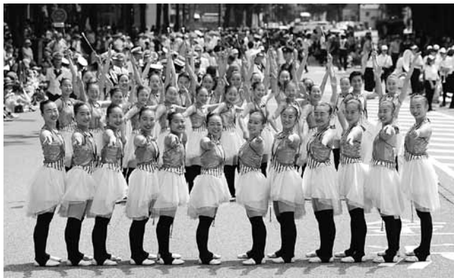
百万石パレード「3年生たちの集合写真」